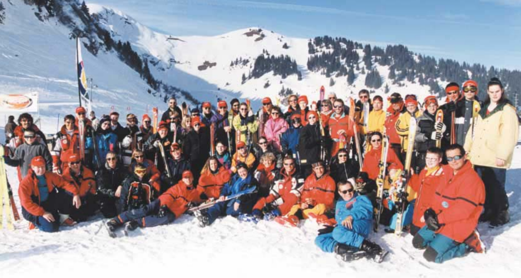
Une école anglaise de 21 jeunes aveugles âgés de 11 à 17 ans et leurs accompagnants au camp de ski à Villars-sur-Ollon patronné et sponsorisé par le RNIB et le Sylvia Adams Charitable Trust.