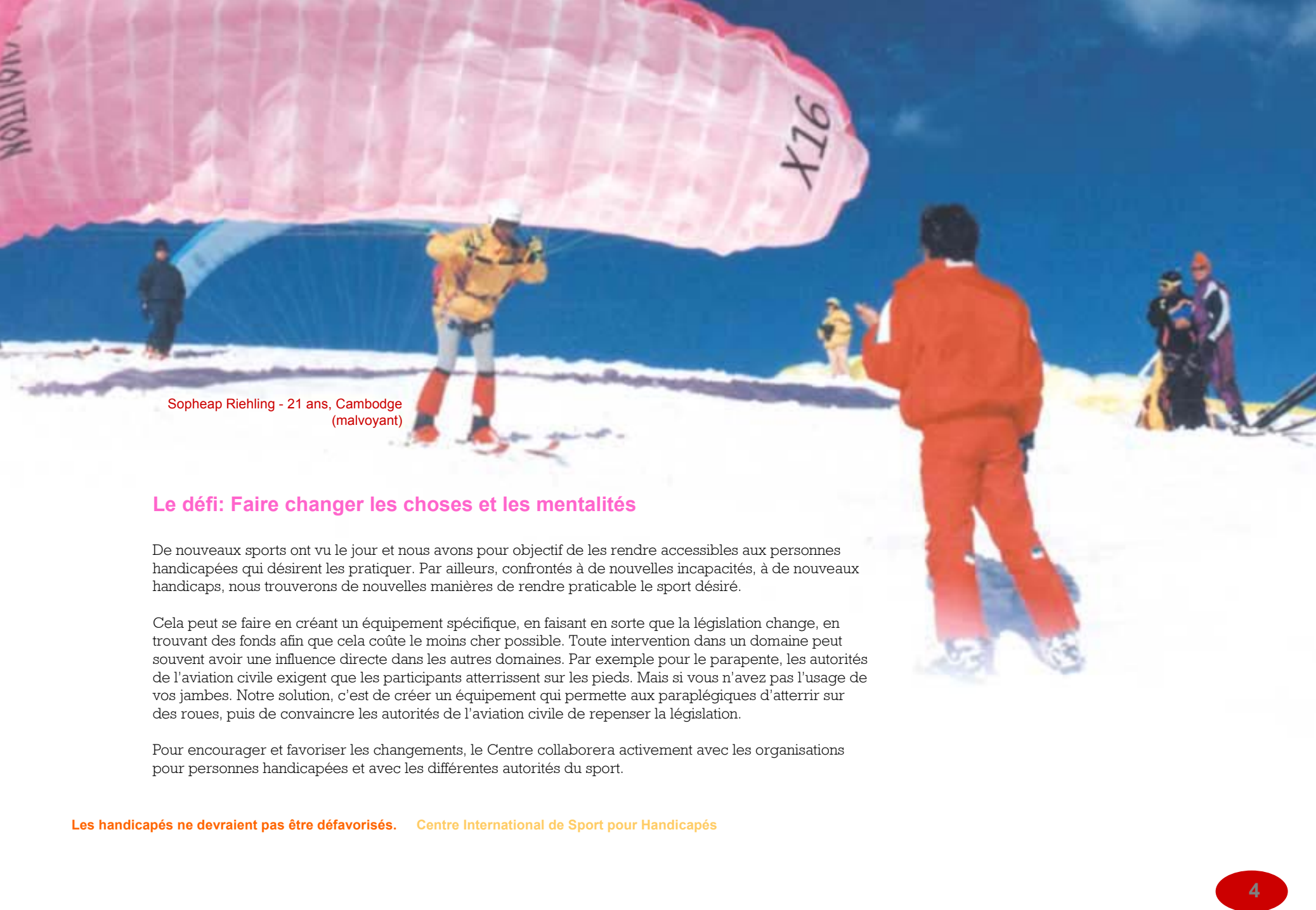
Sopheap Riehling - 21 ans, Cambodge (malvoyant)